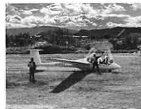
大野滑空場(岐阜県)