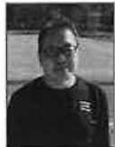
増田副代表 陸上競技部/1982年卒